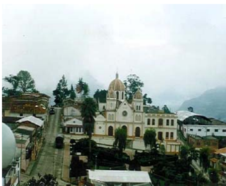
FOTO No. 1. Vista Panorámica Templo Parroquial y Casco urbano Municipio de Herran.