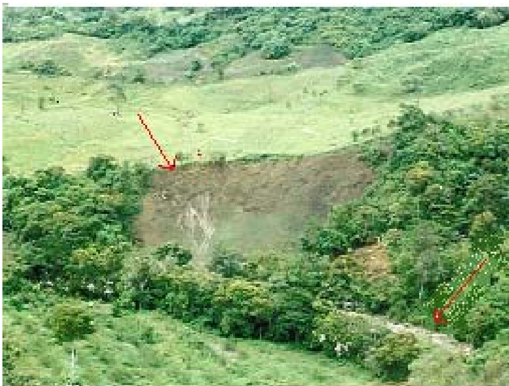
FOTO No. 5. Área de Amenazas y Riesgos sector rural, Margen Izquierdo del Río Táchira, fenómeno de deslizamiento, presionado desde la parte superior urbana. Zona de el Tabor, Municipio de Herran.