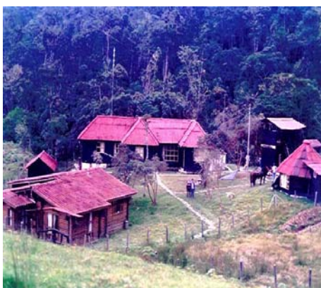
FOTO No. 3.Cabañas del Parque Natural Tama. Herran