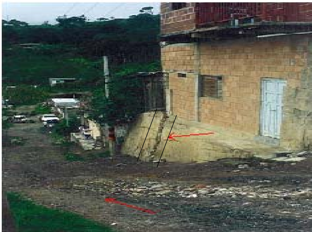
FOTO No. 6 Área de Riego, Sector Urbano, barrio Pablo Sexto, Nivel de rompimiento de las estructuras de las viviendas, Zona declarada en Alto Grado de Riesgo por Deslizamiento.